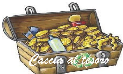
Caccia al tesoro