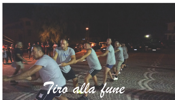
Tiro alla fune