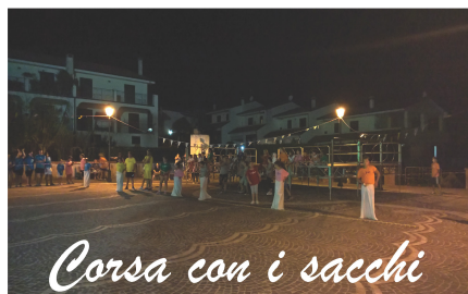
Corsa con i sacchi