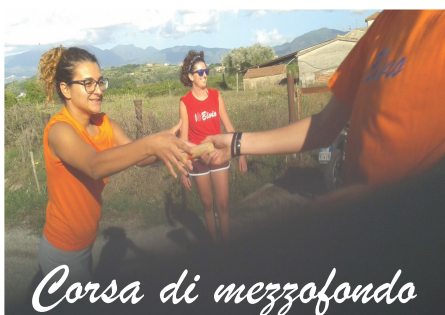
Corsa di mezzofondo