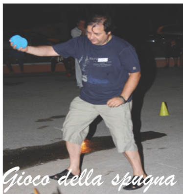
Gioco della spugna