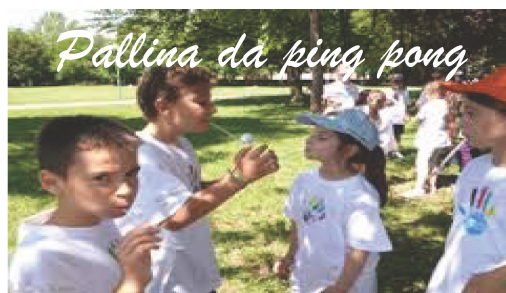
Pallina da ping pong