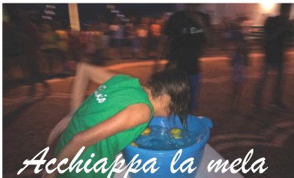
Acchiappa la mela