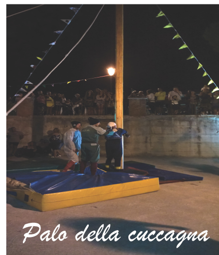
Palo della cuccagna