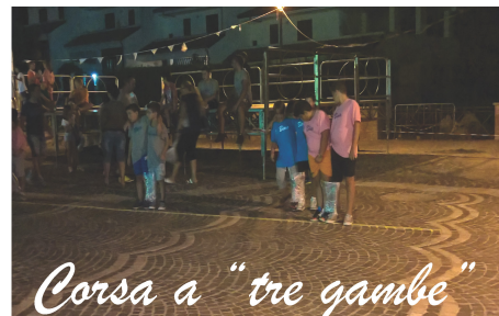
Corsa a "tre gambe"